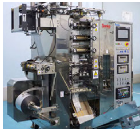
ラミネートパウチ充填機

検査機器：カメラ認証、ウェイトチェッカー、中栓検査、不織布有無検知 対応剤型：液体、乳液、ミルク、ジェル、クリーム、オイル