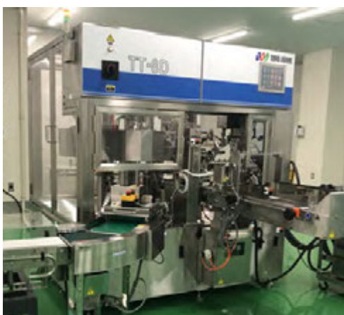
フェイスマスク充填包装機